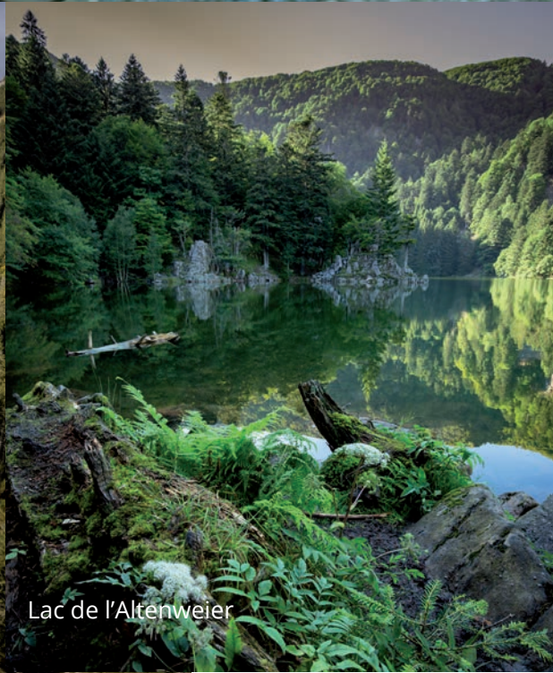
Lac de l'Altenweier