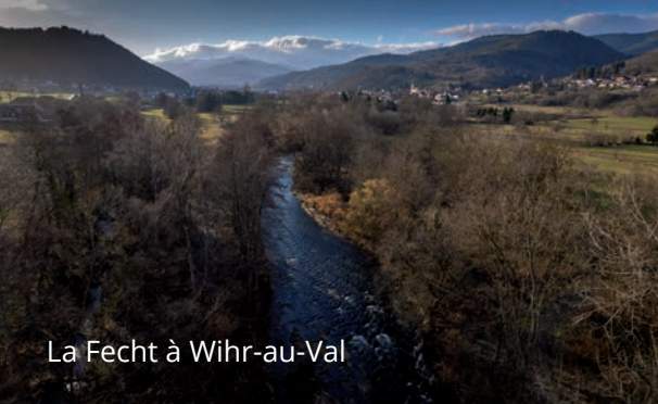
La Fecht à Wihr-au-Val