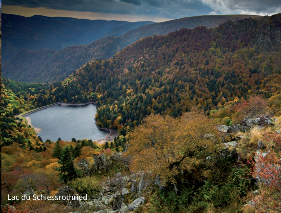
Lac du Schiessrothried