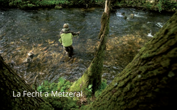
La Fecht à Metzeral