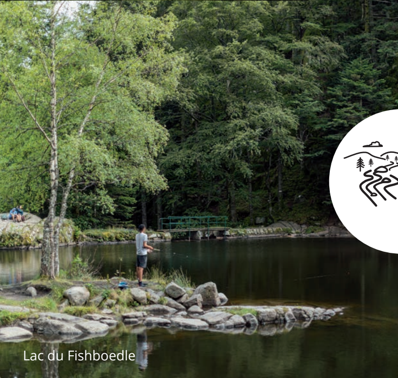
Lac du Fishboedle